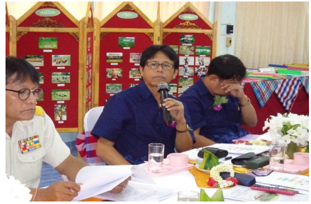
เป็นกรรมการคัดเลือกผลงานของโรงเรียนที่มีผลการปฏิบัติงานที่เป็นเลิศตามหลักปรัชญาของเศรษฐกิจพอเพียงของภาคเหนือ และระดับประเทศ