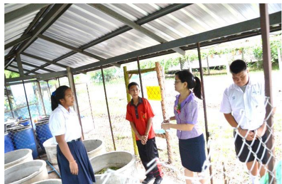
20 กรกฎาคม 2558 โรงเรียนบ้านห้วยลาน อ.หล่มสัก จ. เพชรบูรณ์ เข้าเยี่ยมชม ศึกษา ดูงานฐาน