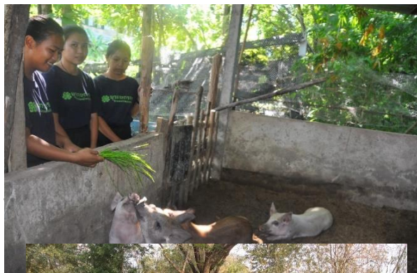
ช ร ล ด

4) กิจกรรมการเลี้ยงหมูหลุม เป็นการเลี้ยงแบบต้นทุนต่ำ ใช้อาหารที่เหลือจากโรงอาหารเป็นหลัก การพัฒนารูปแบบการเกษตรที่เป็นมิตรต่อสิ่งแวดล้อม เป็นองค์รวมของระบบนิเวศนด้านการเกษตร พลังธรรมชาติหมุนเวียนจากพลังงานแสงแดด และน้ำ นำมาเป็นปัจจัยในการปลูกพืช โดยหมูกินเศษพืชผัก ถ้วย มูลบวมวัสดุรองพื้น นำวัสดุรองพื้นไปเป็นปุ๋ยปลูกพืช ผัก นำเศษพืช ผัก ไปเป็นอาหารหมู เกิดวงจรชีวภาพห่วงโซ่อาหาร ดิน พืช สัตว์ จุลินทรีย์