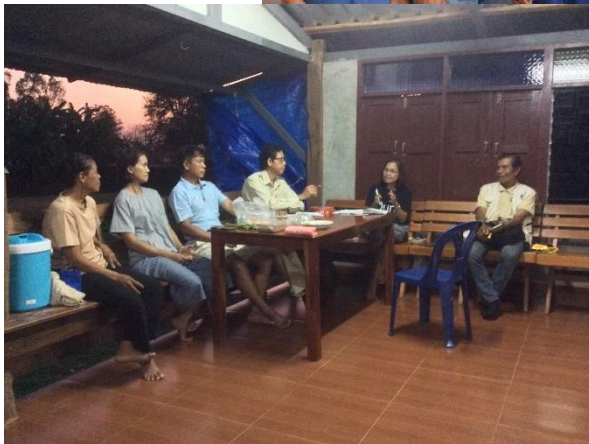
เขารวมกลุ่มเกษตรกรอินทรีย์เพชรบุรี pgs เพชรบูรณ์ กลุ่มนางั่ว เพชรบูรณ์ เพื่อนำมาเป็นแนวทางพัฒนายุวเกษตรกร ชุมชน ในอนาคต