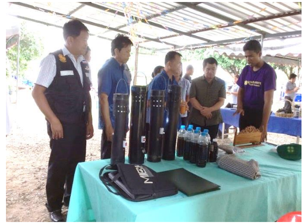
จำหน่ายไส้เดือนและแนะนำวิธีเลี้ยงเพื่อลดต้นทุนการเกษตรกับ อบต.ตาลเดี่ยว อ.หล่มสัก จ.เพชรบูรณ์