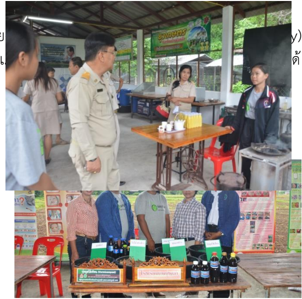
28 กรกฎาคม 2558 กลุ่มเยาวชนเกษตรกรโรงเรียนบ้านบึงคล้าโดยการสนับสนุนขององค์การบริหารส่วนตำบลบึงคล้า อบรมเชิงปฏิบัติการทักษะอาชีพทางการเกษตรให้ราษฎรตำบลบึงคล้า