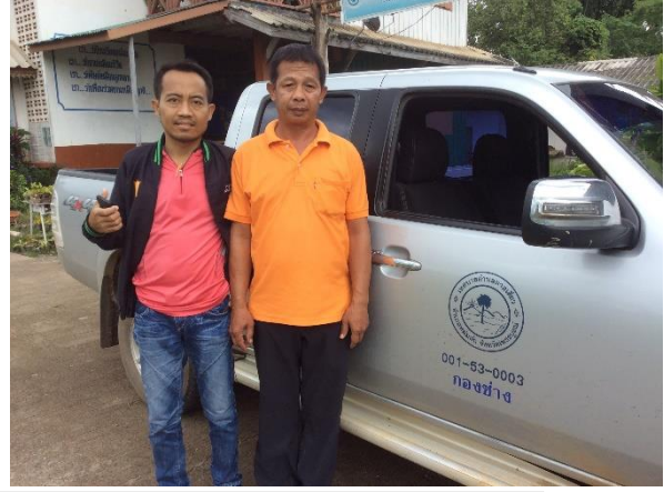
14 กุมภาพันธ์ 2562 จัดอบรมถ่ายทอดการเลี้ยงไส้เดือนเพื่อผลิตปุ๋ย ให้กับคณะครู นักเรียน โรงเรียนบ้านห้วยกะโปะ อ.น้ำหนาว จ.เพชรบูรณ์