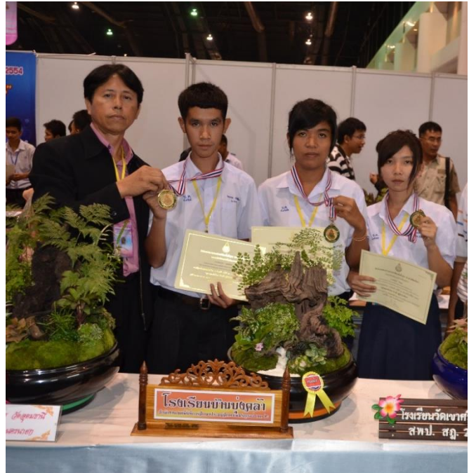
ผู้ฝึกสอนรางวัล ชนะเลิศเหรียญทอง ระดับประเทศ การจัดสวนภาคขึ้น