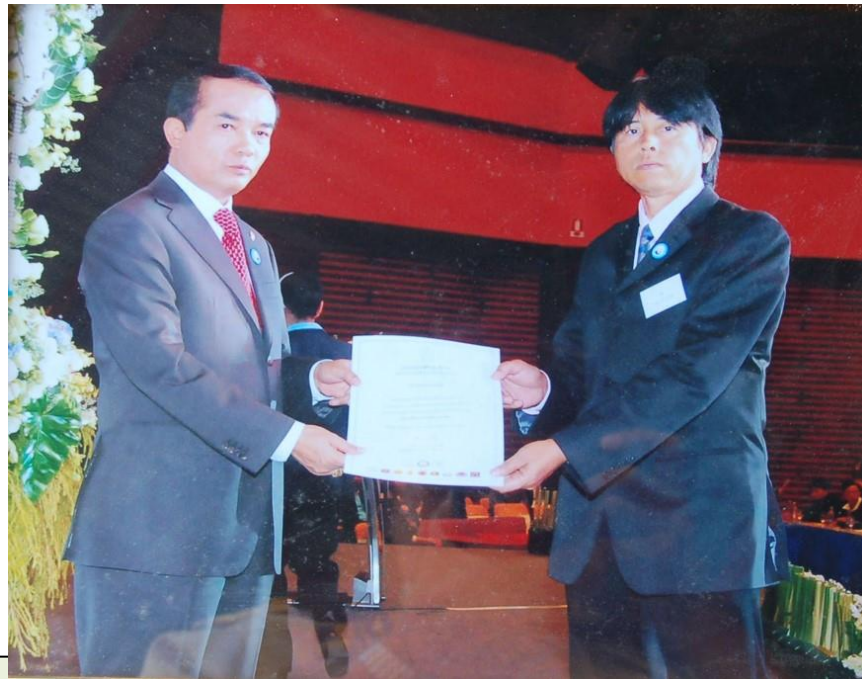
ตัวแทนรับเกียรติบัตร "สถานศึกษาพอเพียง ๒๕๕๒" จากรัฐมนตรีว่าการกระทรวงศึกษาธิการ