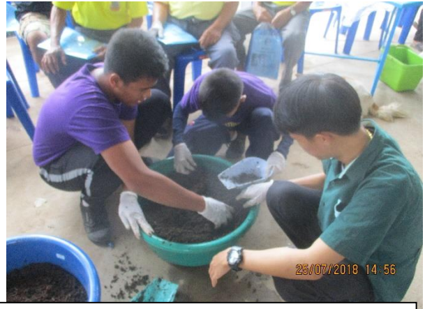
นำเสนอการเลี้ยงไส้เดือนเพื่อลดต้นทุนการเกษตรกับเกษตรกรตำบลป่งคล้า อ.หล่มสัก จ.เพชรบูรณ์