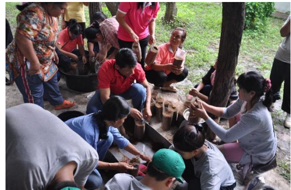
31 สิงหาคม 2558 นำฐานเรียนรู้การเลี้ยงไส้เดือนร่วมกิจกรรมถ่ายทอดความรู้โครงการส่งเสริมการเกษตรในรูปแบบแปลงใหญ่ของอำเภอหล่มสัก จ. เพชรบูรณ์ เพื่อให้ประชาชนผู้สนใจได้เรียนรู้การลดต้นทุนในการผลิต