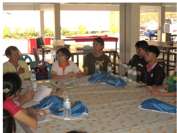
เป็นวิทยากรอบรมเยาวชนให้มีลักษณะนิสัยตามหลักปรัชญาของเศรษฐกิจพอเพียงระดับภาคเหนือ ที่ศูนย์ศึกษาการพัฒนาห้วยฮ่องไคร้ เชียงใหม่