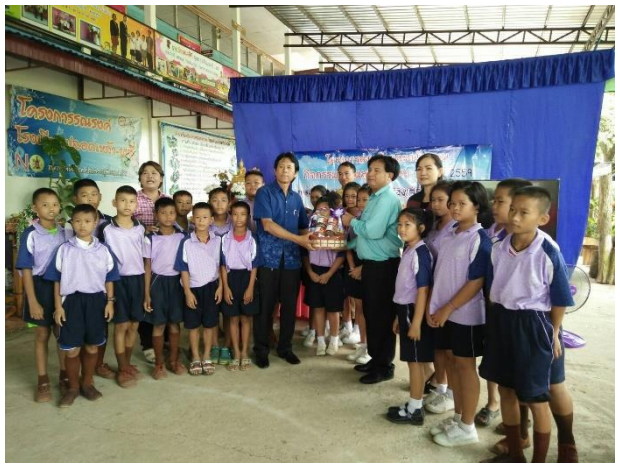
เป็นวิทยากรอบรมเยาวชนให้มีลักษณะนิสัยตามหลักปรัชญาของเศรษฐกิจพอเพียงของโรงเรียนในเขตสำนักงานเขตพื้นที่การศึกษาประถมศึกษา เพชรบูรณ์ เขต 1